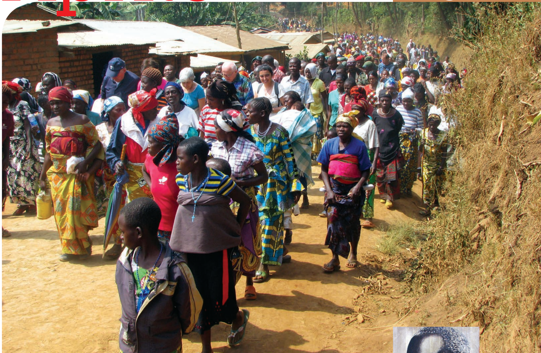
Kivu, Congo RD, processione in memoria dei martiri