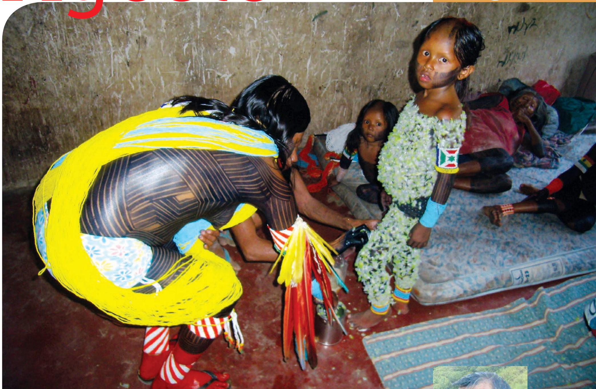
Kayapò, preparazione alla festa