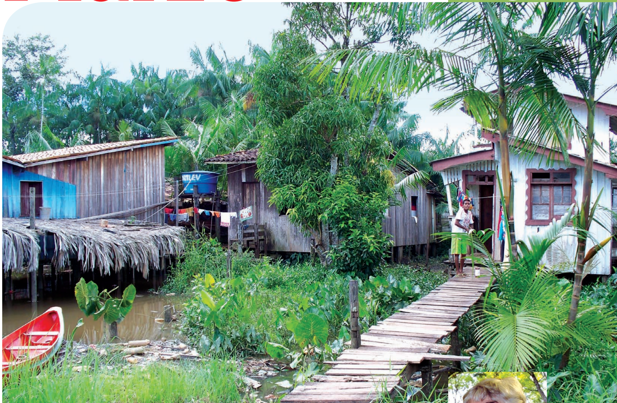
Abitazioni nella periferia di Abaetetuba, Brasile