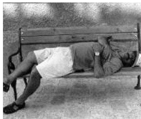
AUGURI DAL PRESIDENTE