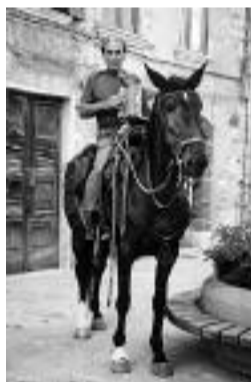
AUGURI DAI PIÙ ANZIANI