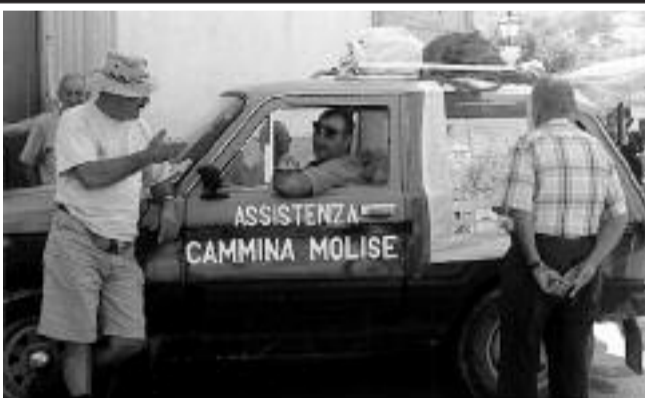
Gli autisti del servizio Bus e Santino, "l'acquagliolo"