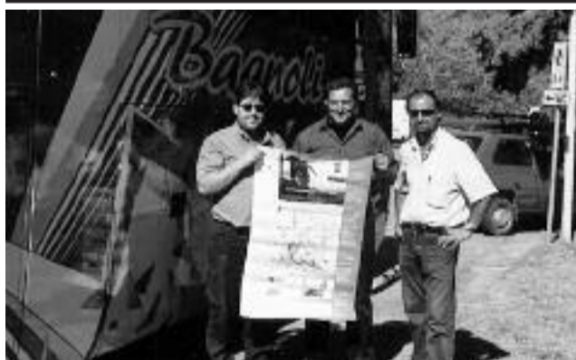
AUGURI DAGLI AUTISTI