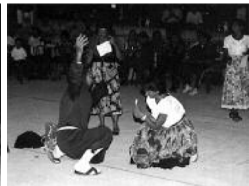
Due momenti della "Performance" di Fossalto del Gruppo di Ricerca di Danze Popolari "Gli Scacciapensieri"