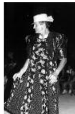
AUGURI DAGLI SCACCIAPENSIERI