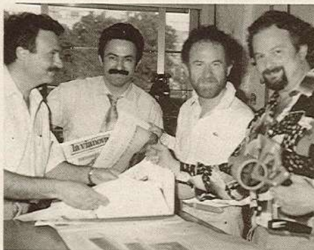
Alcuni membri del Comitato di Redazione mentre allestiscono il n. 0 de "la vianova"