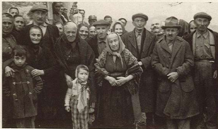
Sul colle della Madonnella - Primi anni '60