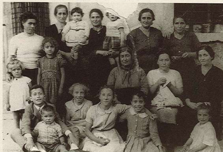
Primi anni '60

A'R'CORD'T: ABBONATI! LA PUBBLICAZIONE DE "LA VIANOVA" DIPENDE ANCHE DA TE