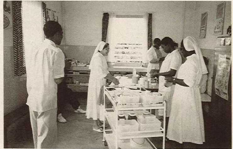
Suore al lavoro nel dispensario medicine