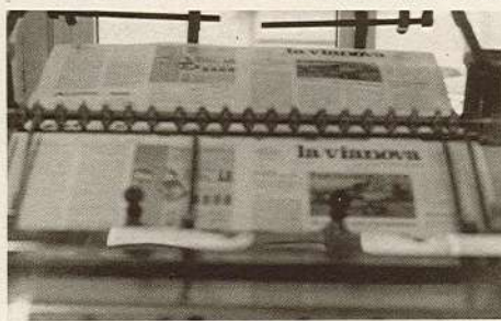
La prima pagina del numero 0 de "la vianova" mentre esce dalla macchina litografica