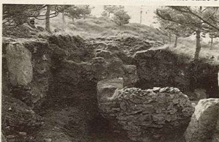
Civita: ruderi sannitici messi alla luce dai soci dell'Archeoclub

Il Salomon ha il torto, secondo il nostro pensiero, di aver preso per oro colato tutte le notizie che si dimostravano chiaramente false o esagerate, scritte